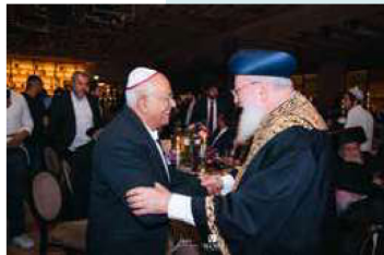
צ'נור ישראל ת"א' במיל' אביגדור קהלני, עם הראשון לציון הרב שלמה עמאר שליט"א

ברצוני להודות לקהילת חב"ד בתל אביב יפו על החוויה להיות איתם ביום תגם - יום חגנו.